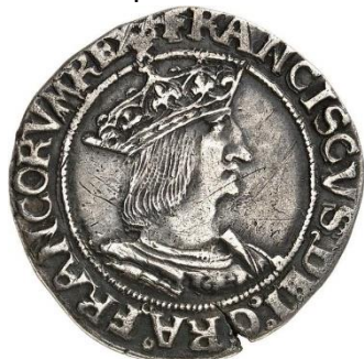
Doc 3. Le roi jeune, à la couronne royale fermée. Teston de François 1 er , monnaie émise entre 1521 et 1540, diamètre : 28,5 mm. Bibliothèque nationale de France, Paris. Le nom du roi Franciscus (François en latin) est inscrit sur la pièce.

Le roi a dépassé ceux qui l'ont précédé. Il fait payer plus d'impôts que jamais. Il gagne de nouvelles terres pour le domaine royal sans en perdre aucune. Personne à la Cour n'ose contester ce que dit Sa Majesté. Il lui suffit de dire : « Je veux telle somme ; j'ordonne ceci ; je consens à cela. » Et c'est aussitôt exécuté, aussi vite que si la population avait pris cette décision elle-même. Tout dépend de lui seul, la paix et la guerre, les impôts... Bref le roi est le maître absolu.