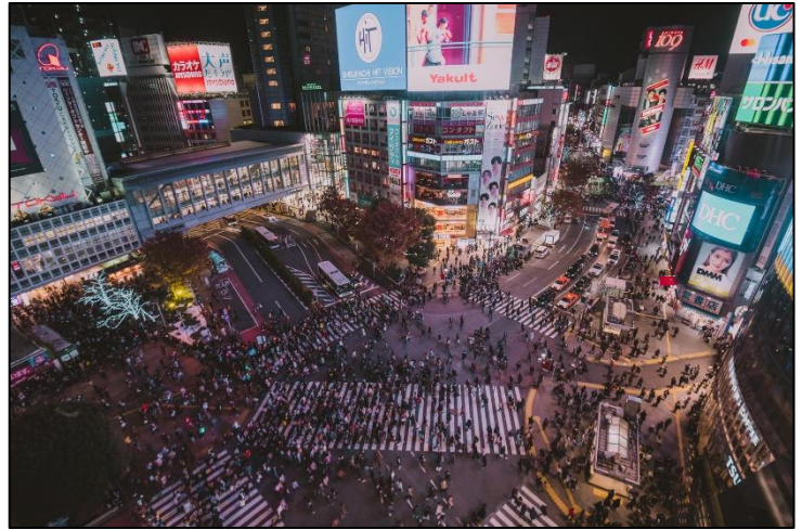
Doc 5. La croissance des villes : Tokyo (Japon)

Cette agglomération est l'une des plus polluées du monde à cause des gaz d'échappement des voitures et des fumées des usines.