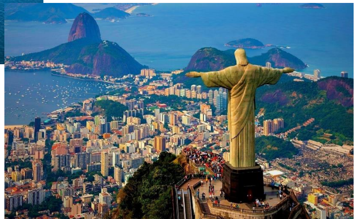
Doc 4. Rio de Janeiro (Brésil)