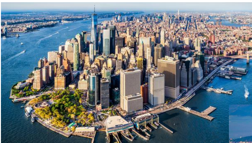
Doc 3. New York (Etats-Unis)