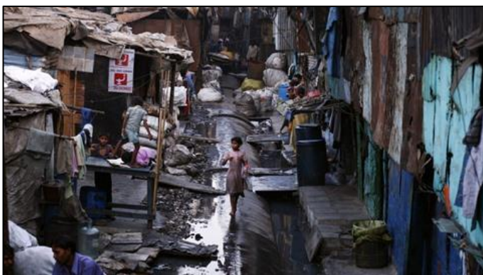
Doc 6. Une rue de Bombay (Inde)

Les villes attirent les populations. Dans les pays pauvres, les ruraux quittent la campagne en espérant trouver une vie meilleure à la ville : c'est l'exode rural. Mais, les villes qui les accueillent manquent d'eau potable, d'hôpitaux et d'écoles. La majorité de la population n'a