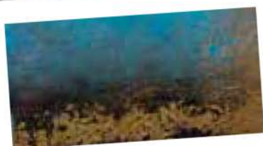
Peinture S. Bénéteau