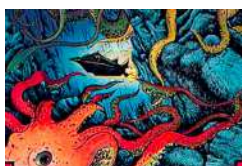
20 000 lieues sous les mers CE2-CM1