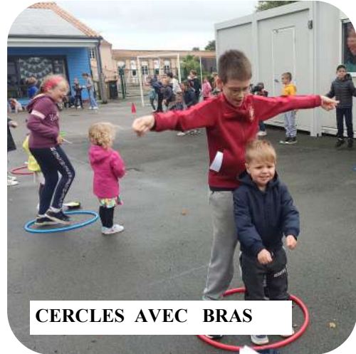
CERCLES AVEC BRAS