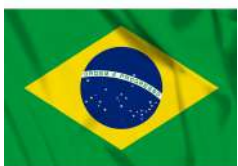
Cap sur le Brésil CE1-CE2