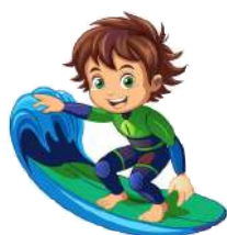
Surfin' USA CP