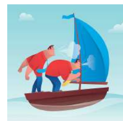
Le vent dans les voiles des CM CM1-CM2 et les adultes