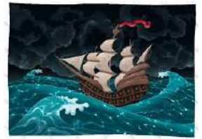
Tempête en mer CM2