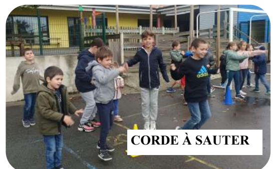
CORDE À SAUTER