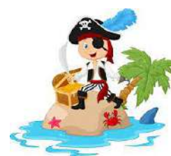
Pirate des Caraïbes MS-CS