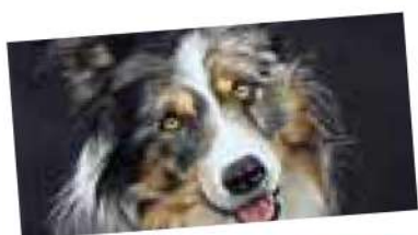
Peinture GOULIQUER Alain